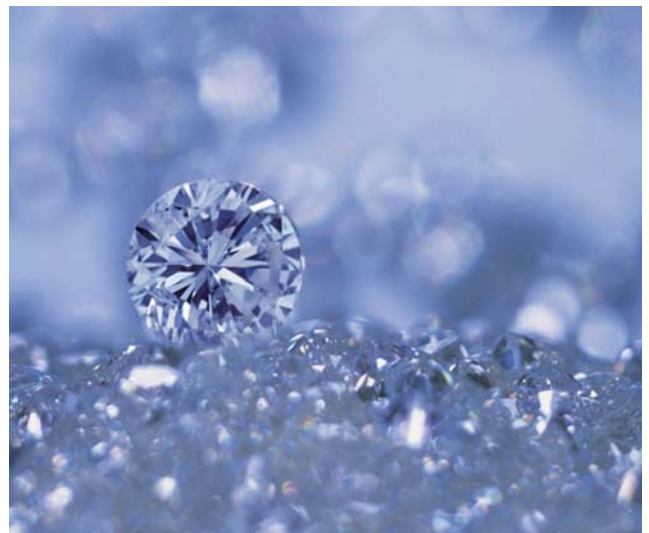
★ヴァージンダイヤトリプルエクセレント 1,000 ピース以上確保